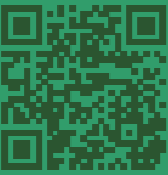
和菓子ストリート Instagram

最新情報はInstagramからご確認ください https://www.instagram.com/wagashistreet/