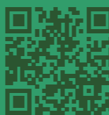
県教育文化事業団 HP