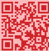
伊勢崎市観光物産協会 HP

主催 = 伊勢崎市 主管 = 伊勢崎市観光物産協会 企画ディレクション = 後藤大樹 問合せ = 伊勢崎市観光物産協会 (文化観光課内) TEL 0270-27-2759