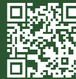
伊勢崎市観光物産協会 HP

詳細はHPよりご確認ください https://isesaki-kankou.com/info/buraburameisen/